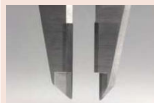
Měřicí čelisti pro vnější měření osazené tvrdokovem Obj. č. 505-734 / 505-735