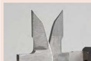
Měřicí čelisti pro vnější/vnitřní měření osazené tvrdokovem Obj. č. 505-735